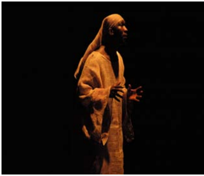
Les bouts de Bois de Dieu