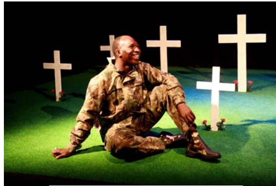
Les Ames Oubliées